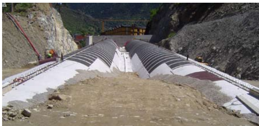
S'han col·locat un total 138 peces que van ser transportades d'una en una fins a l'obra. Estat de l'obra el 19-07-2011.