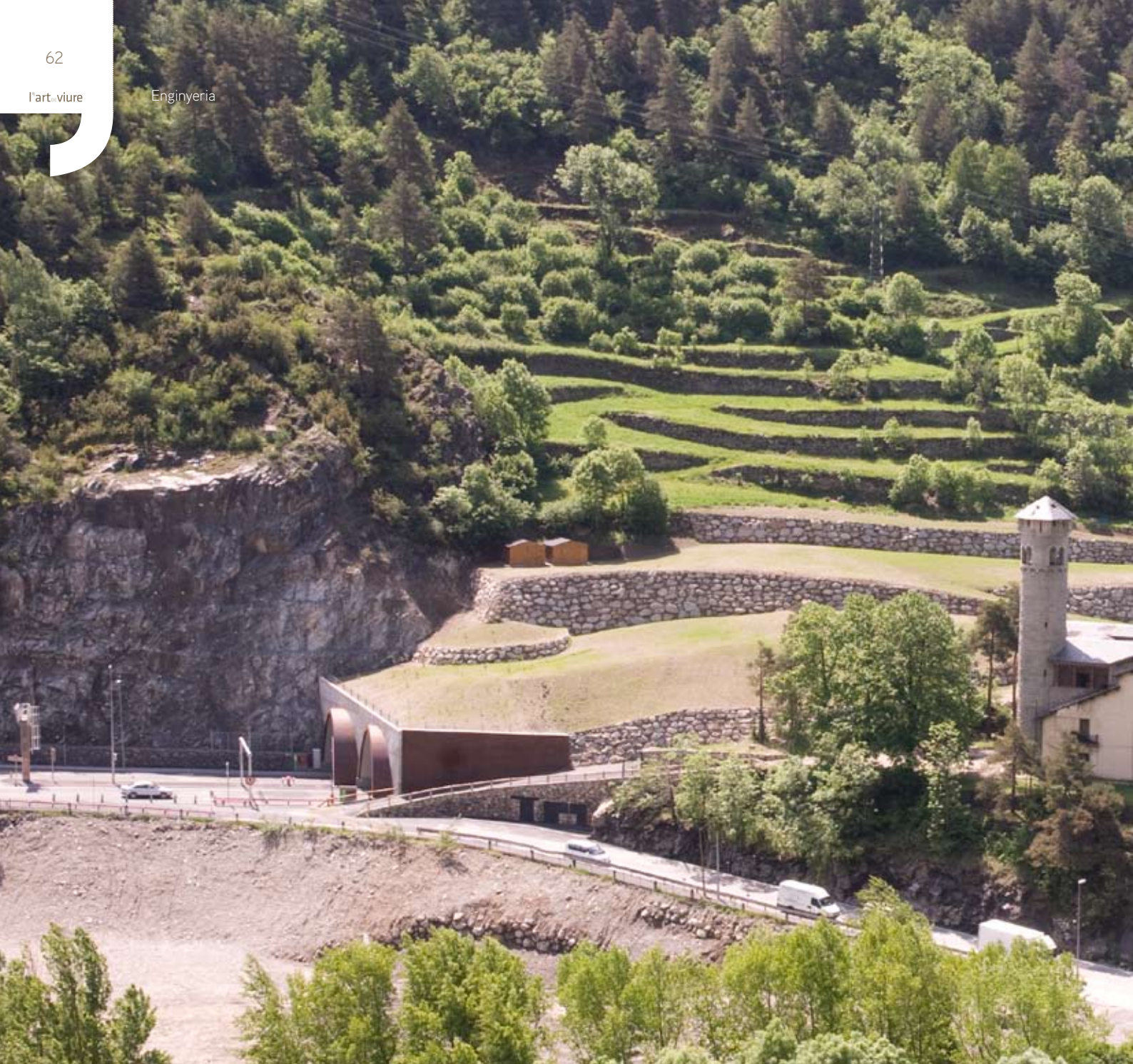
Vista general des de Vila.