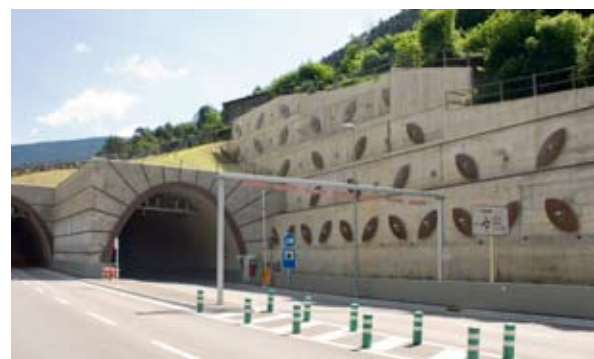
El mur ancorat construït a la boca sud.

Els treballs es van iniciar el mes de setembre del 2009 i es van acabar el desembre del 2011. S'ha inclòs en aquesta obra la posada en servei, en totes les fases de millora, del tram de C. G. 2 amb circulació de quatre carrils (dos per sentit).