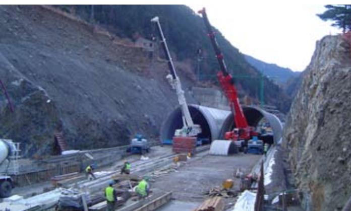
Les dovelles que conformen els falsos túnels han estat fabricades per Adhorna, a la població de Calaf (Barcelona). Estat de l'obra el 9-12-2010.